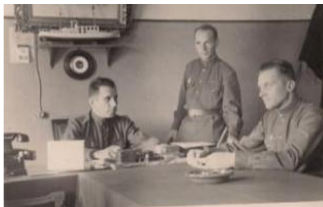
Фото 5. На обороте: 28.07.1947. Калининград. Это были боевые будни, Помни