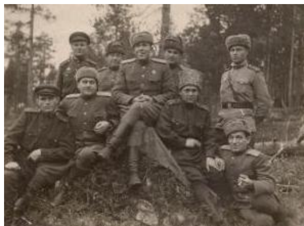
Фото 5. 8.11.1944. После боев. Большой привал, район Вирбаниеми, Печенегская область