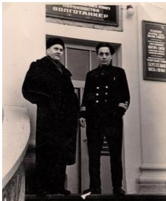
Фото 7. На пороге «любимой работы»