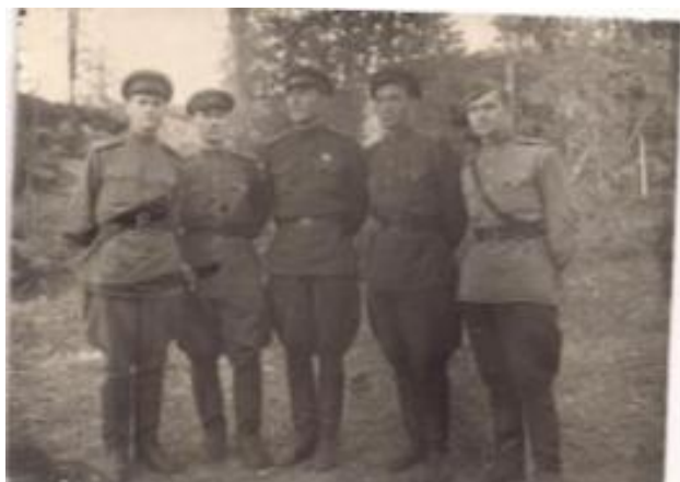
Фото 4. 17.09. Ухта.