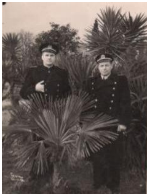
Фото 6. На отдыхе в Сочи 1952 г.