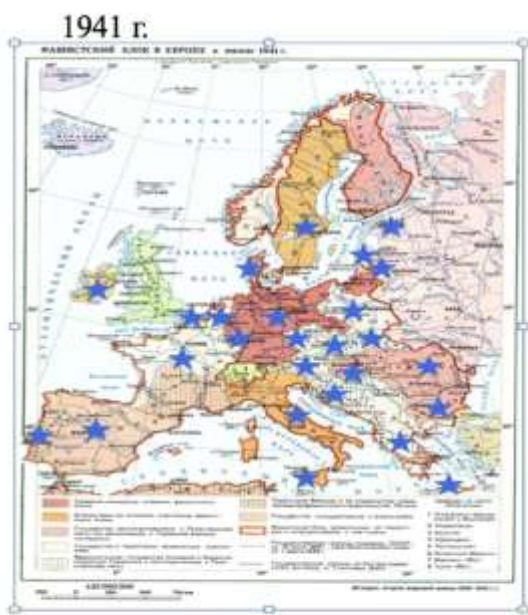
1. Финляндия. 2. Румыния. 3. Италия. 4. Словакия. 5. Венгрия. 6. Хорватия. 7. Греция