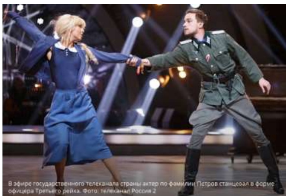
В эфире государственного телеканала страны актер по фамилии Петров станцевал в форме офицера третьего ранга.

Деградация ценностей, плевков в память наших предков!