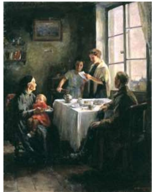
Ватолина Н. Н. Вести с фронта