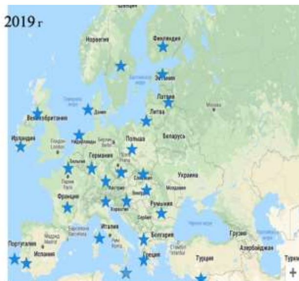
1. Австрия. 2. Болгария. 3. Бельгия. 4. Великобритания. 5. Германия. 6. Венгрия. 7. Греция. 8. Италия. 9. Испания. 10. Дания. 11. Ирландия. 12. Литва. 13. Латвия. 14. Республика Кипр. 15. Мальта. 16. Нидерланды. 17. Люксембург. 18. Словения. 19. Словакия. 20. Польша. 21. Финляндия. 22. Франция. 23. Португалия. 24. Румыния. 25. Хорватия. 26. Швеция. 27. Чехия. 28. Эстония

Претенденты: Сербия, Черногория, Македония, Турция, Албания