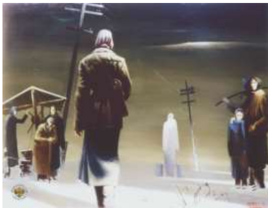
Ватолина Н. Н. Вести с фронта