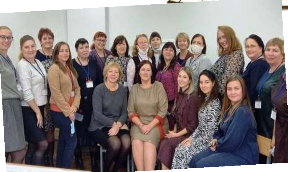
Мировое кафе - это метод фасилитации групповых обсуждений, в котором приоритетно общение между участниками встречи и добавление новых мыслей и идей.